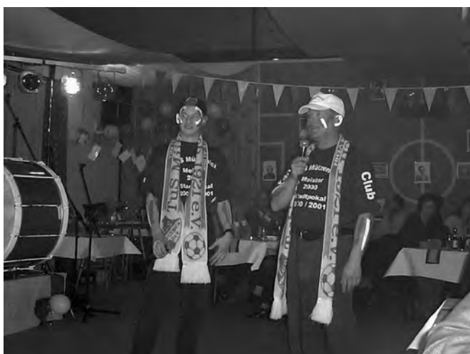
Gaben ihr Debüt: Kruse & Michi

Kruse und Michi hatten einiges zu bieten. Sie wussten von manchen (Un-) Taten und angeblich Geschehenem verschiedener TuS-Cracks zu berichten. Die Fan-Band – bestehend aus jungen Leuten des TuS, des TV, des Musikvereins und des Korps, weckte nach der Melodie eines Titels des Mützenicher Schlagersängers Benny White früh die Aufmerksamkeit des Publikums.