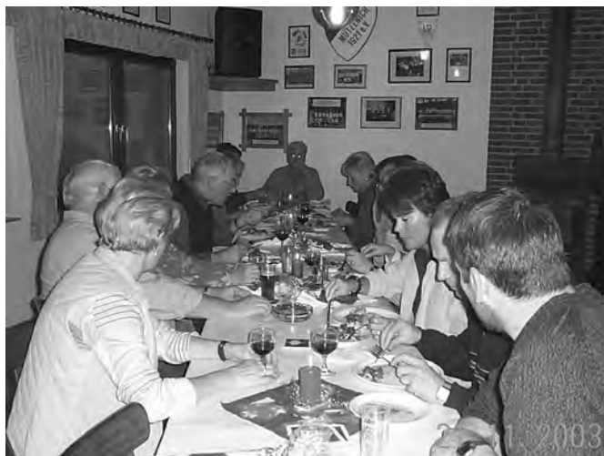
Festlich gedeckte Tafel im Sportheim