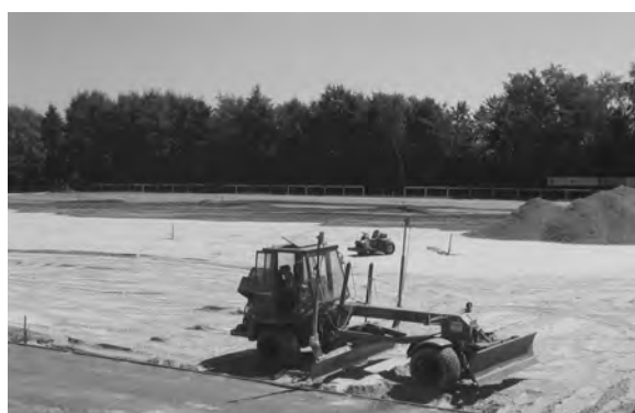
Am Ende soll alles schön "plan" sein