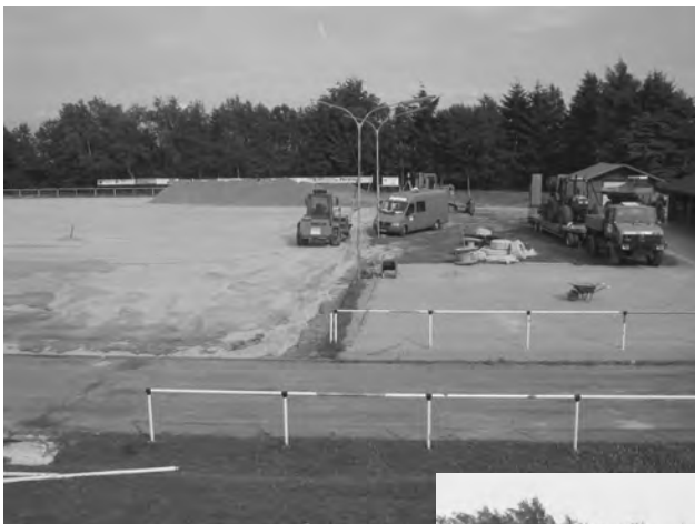
Abschieben der Grasnarbe und Auftragen der Rasentragschicht