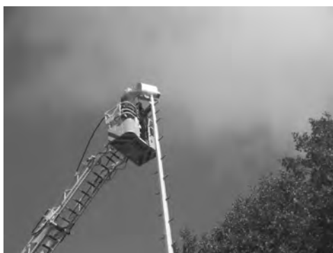
Feuerwehrunterstützung für die Beleuchtung