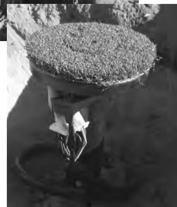
So sieht ein Beregnungskopf aus