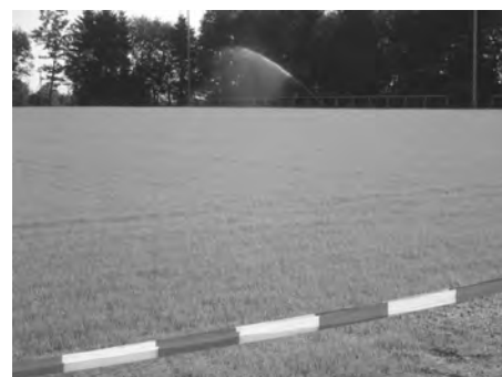
Ein erstes zartes Grün zeigt sich. Im Hintergrund läuft ein Beregner