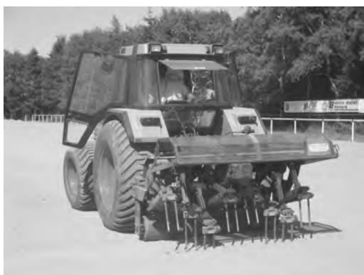
Die Einsaat mit der Maschine