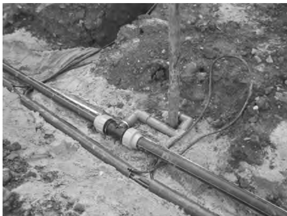
Die Leitungen für Beregnungsanlage und Flutlicht