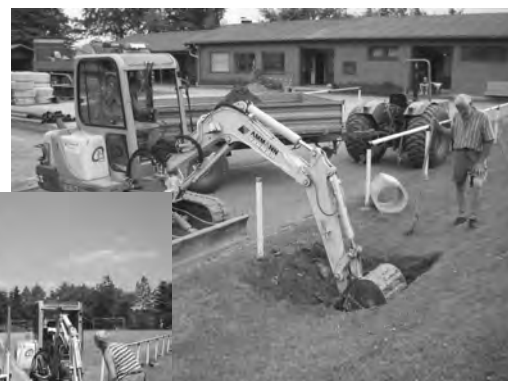
Aushub der Fundamente für die Flutlichtmasten