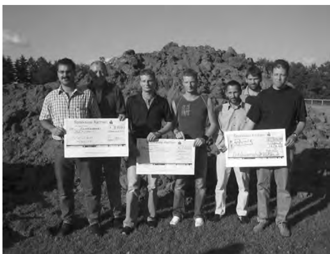
Danke für alle Spenden !