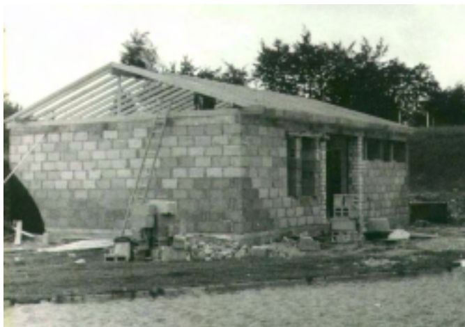
Sportheim damals ...