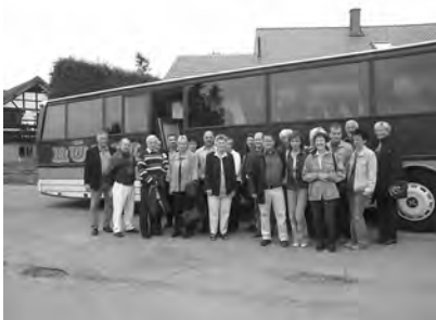
Abfahrt bei Manni in der Buche